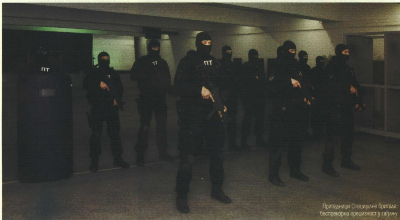
Припадници Специјалне бригаде: беспрекорна прецизност у гађању

миран је 63. падобрански батаљон. Тако да су то сад све јединице Специјалне бригаде, с тим да смо речне, некада поморске диверзанте, уградили у 72. извиђачки диверзантски батаљон као 82. чету речних диверзаната. А један део „Кобри“, који се и тада бавио противтерористичким дејствима, прешао је у наш батаљон за противтерористичка дејства. „Кобре“ су