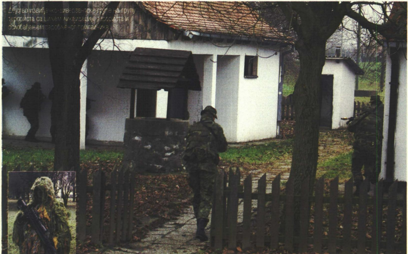
Dejstvo izviđačko-živorazmatke grupe na grupu terorista sa ličnim likvidacije terorista i oslobađanjem zarobljenog pripadnika